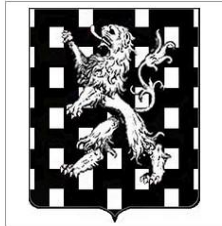
RAYBE de SAINT-MARCEL - Forez

Pourrait-être celui des seigneurs de Saint Marcel d'Urfé, voir celui de Gabrielle de Montrenard: "De sable semé de billettes d'argent au lion de même"